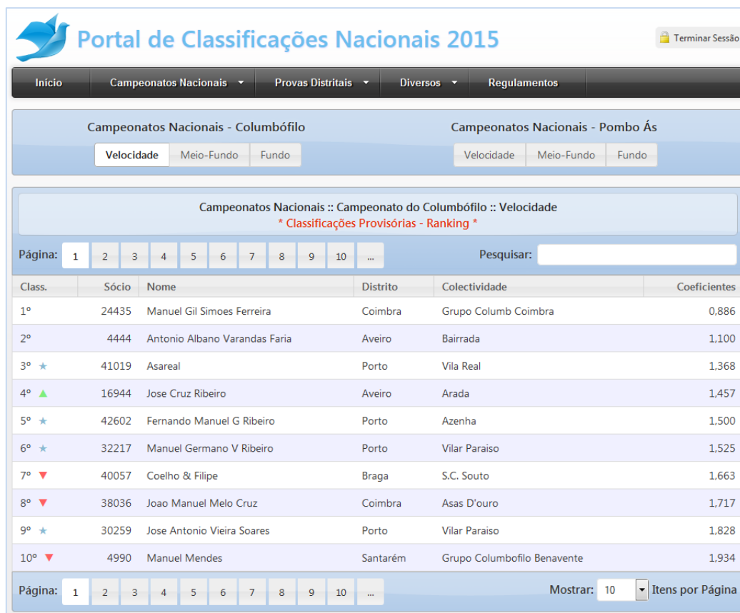
Figura 7 – Consulta das classificações dos Campeonatos Nacionais

Esta secção disponibiliza as classificações dos Campeonatos Nacionais, divididas pelas vertentes Columbófilo e Pombo Ás, cada uma delas subdividida nas especialidades Velocidade, Meio-Fundo e Fundo. Use o menu do site para escolher a categoria e especialidade desejadas.