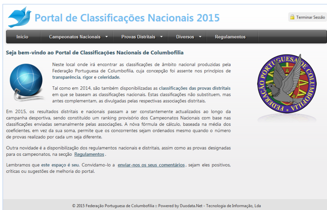
Figura 1 – Página inicial do Portal

A página inicial do Portal de Classificações Nacionais 2015, acessível através do endereço nacionais2015.fpcolumbofilia.pt , apresenta um menu horizontal na parte superior da janela que permite o acesso às várias áreas funcionais. Do lado direito, o logotipo da FPC certifica a filiação do portal, permitindo também aceder ao site principal da FPC.