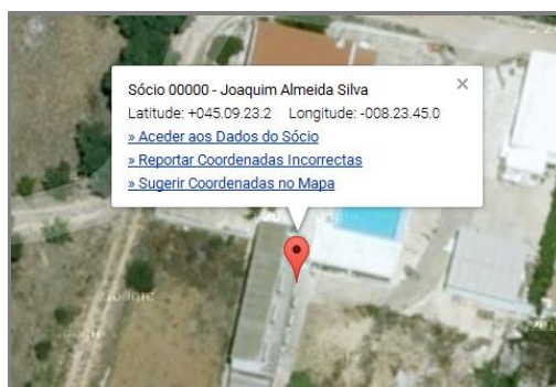
Figura 2 – Janela pop-up com informações e acções relativas ao concorrente

Faça um clique sobre a marca. Aparecerá uma janela com informações sobre o respectivo concorrente, assim como ligações para as várias acções possíveis. Faça clique no X ou no mapa para fechar essa janela.